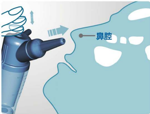
吸鼻組：各項零組件 (圖2)